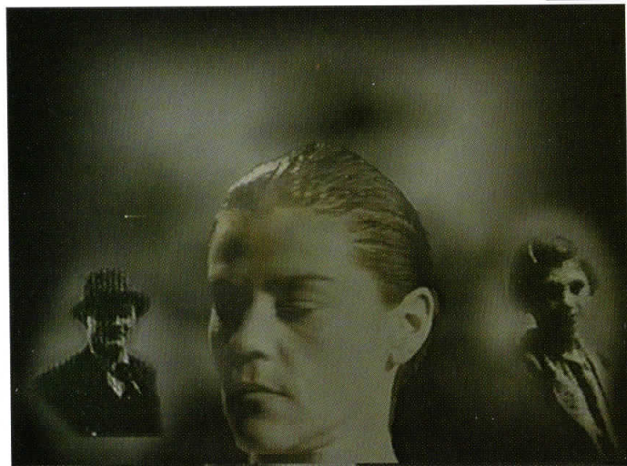
Autopsyoanalysis, VHS, 5 min

The waving of the faces from the old and new photos associate similarities in the genetic development, while the choice of the time marks reveal emotional and existence similarities. The transformations gained by the reduction of the photo documents shows interactive dualistic elucidation. From one side there is a liberation of the presence of mental prejudices and liberation from the search of own identity, and from the other side this identity is double confirmed. The permanent recognition of our own personality through the time and space leave us a tract for functional reflection on the inner (spiritual) world which is precisely determined in one integral entity